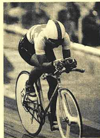
▲ '92年、バルセロナ大会 後どうしていくか。周りに惑わされず、自分でその世界を作っていってほしいと思います」

後からついてくることもある。オリンピックを体験することが、先に与えられたご褒美なのか、後からついてきたご褒美なのかを決めるのは自分。自分自身なんです。なぜ、オリンピックに出て、その