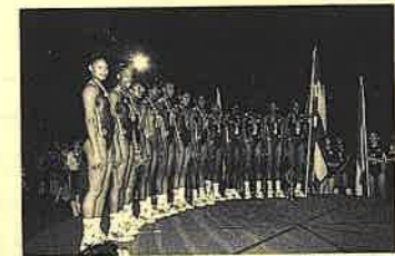
▲"Fashionable Team" 賞を受賞したキューバ

この大会では、The World Most Fashionable Team という賞ができて、女子はハイレグカットのレオタードで試合をしたキューバが受賞し、賞金10,000ドルを獲得した。スポーツはアスリートが鍛え抜かれた肉体と技を競うのであって、ファッションショーではない。デザイン賞があるのはおかしい。