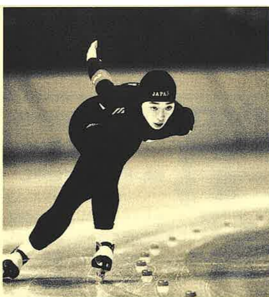
▲ カルガリー大会出場後5種目に入賞

「すごく思います。海外の選手は、出産をしてから記録を伸ばす人がたくさんいます。それはなぜなんだろうとずっと思っていました。彼女たちは怪物じゃないかと思っていました。自分で妊娠してみて、自分の体を知るこの上ない経験だと感じています。母体として子供との一体感を感じる。