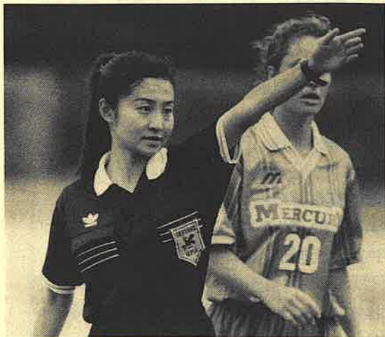
目標はワールドカップで主審を務めること

「高校に入学した時に、世界を目指せるスポーツということで、サッカーを始めました。(女子サッカー部が無く)男子サッカー部に入りました。一緒に練習はしていたのですが、公式試合に出られなかったので、4級審判員の資格を取りました。