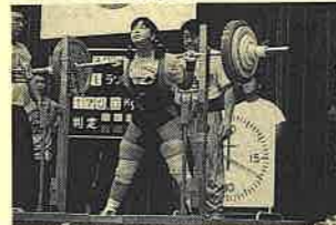
▲ 美人リフター必須科目

義父は「年寄りの冷や水」と渋い顔をしていたが、義母はせっせと車でゴルフ場に通り、ビデオでフォームを研究し、ぐんぐんスコアを伸ばしていった。以来10年。運転は無事故無違反。ゴルフは「ちょっと海外のコースにいくから、お留守お願いね」という腕前にまどなった。「こんな面白い世界が人生にあったのね」と、ますます元気だ。